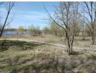
Место разминки и размещения