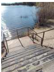
Мост со ступеньками.