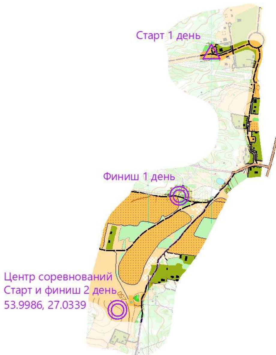
Схема центра соревнований:

Расположение центра соревнований - Беларусь, Воложинский район Координаты: 53.9986, 27.0339.