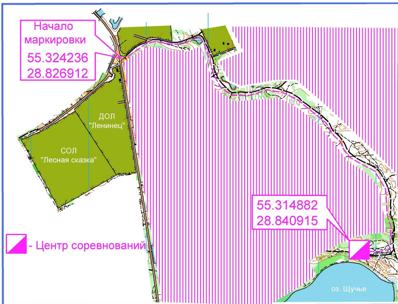
Схема проезда к центру соревнований