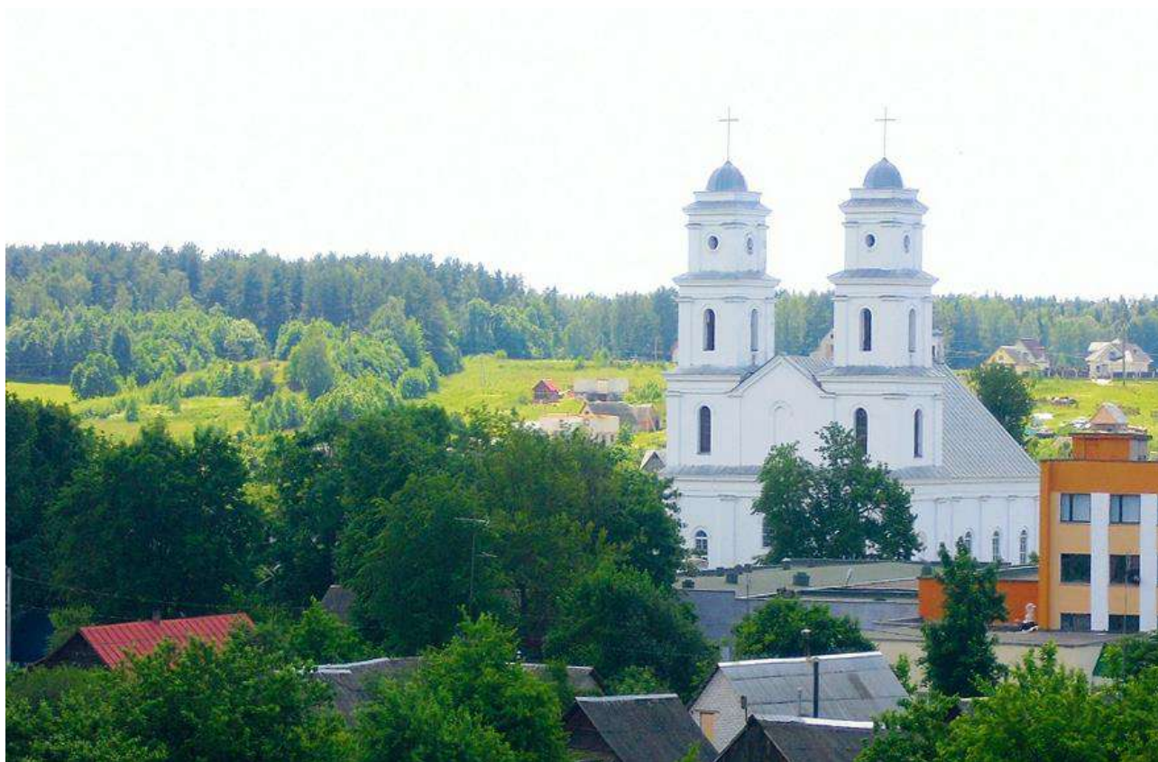
Пейзаж Радошковичей.